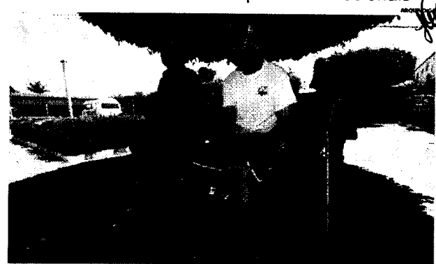
Isolamento social provocado pela pandemia trouxe consequências para os idosos em AL

Além das consequências emocionais, sem visitas, e consequentemente doações, a instituição se vê num momento difícil. "Já estamos perdendo muito desde a situação do afundamento na região da antiga casa, as visitas já haviam caído muito e logo depois veio a pandemia. Tivemos ajuda de alguns projetos de iniciativa privada, mas isso já foi encerrado e a casa agora segue para um período de grande aperto", afirma ainda a coordenadora. O lar, que dispunha de 21 quartos e tinha acabado de expandir as dependências pouco antes do primeiro episódio de tremor de terra, conta agora com apenas 10, um reservado para o isolamento de qualquer caso suspeito de Covid, com 30 idosas, sua lotação máxima.